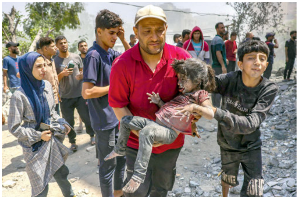
Dziecko wyciągnięte spod gruzów domu po izraelskim ataku w Saftawi na zachód od Dżabalii, w północnej Strefie Gazy, 9 czerwca 2025 r.